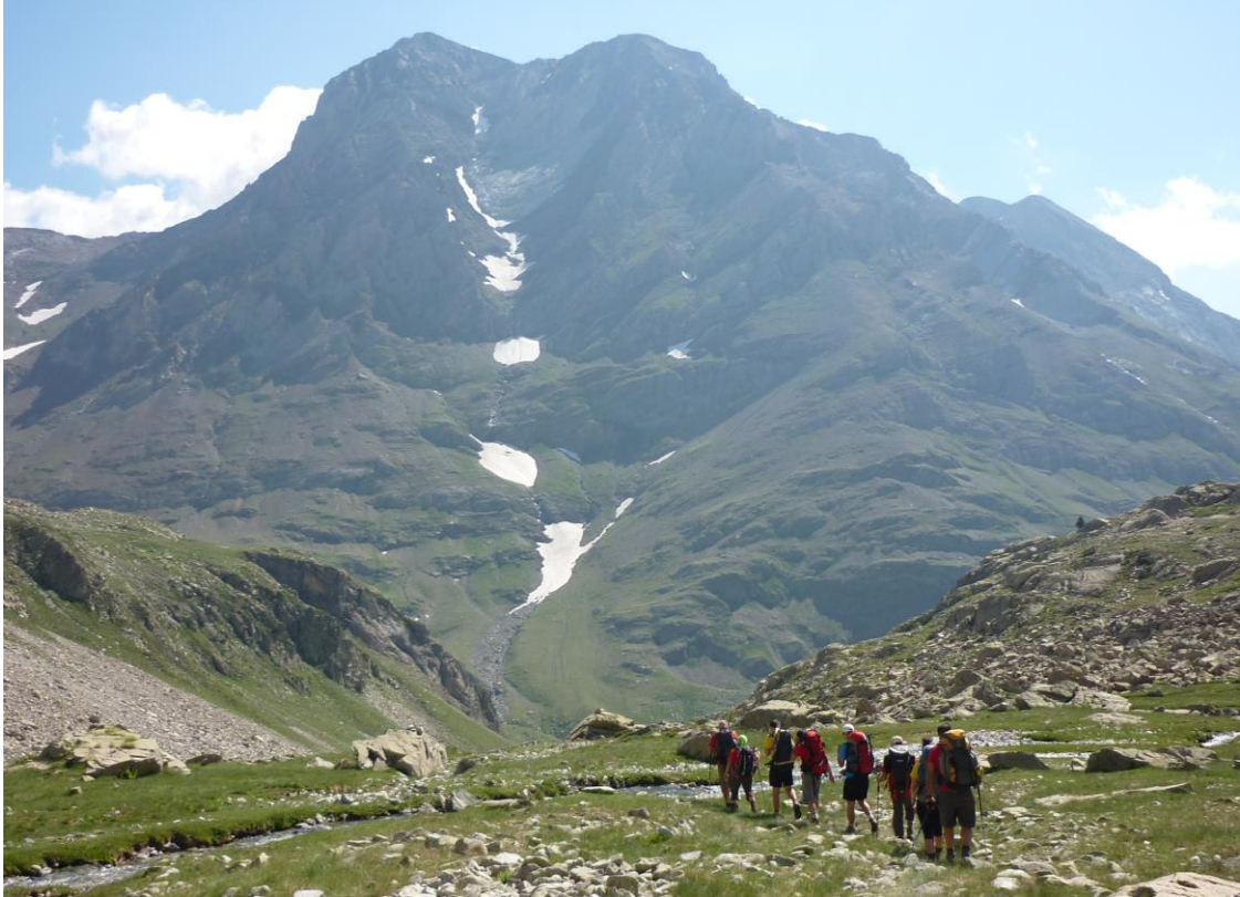
Miembros de SanBur en una travesía pirenaica estival pre-pandemia

IMPORTANTE: Como en otras ocasiones... cargaremos la mochila de travesía en el bus y el pequeño equipaje de cambio se quedará donde nos indique el conductor (posiblemente en la cochera de San Esteban). Dispondremos de conductor, bus y equipaje, el viernes 9 de agosto sobre las 14 horas en el aparcamiento del puente San Jaime de Benasque.